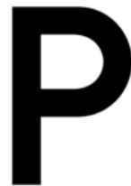
Parkplätze vor dem Haus